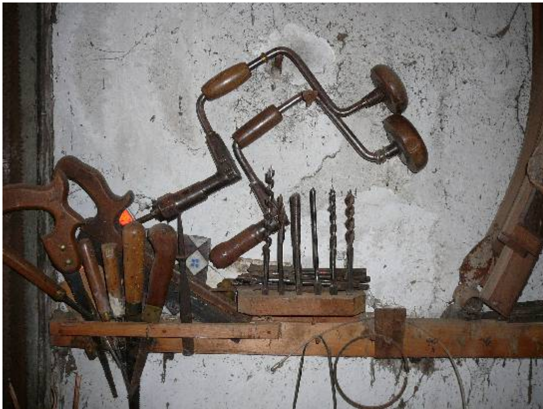
Ciseaux à bois Vilebrequins ses mèches