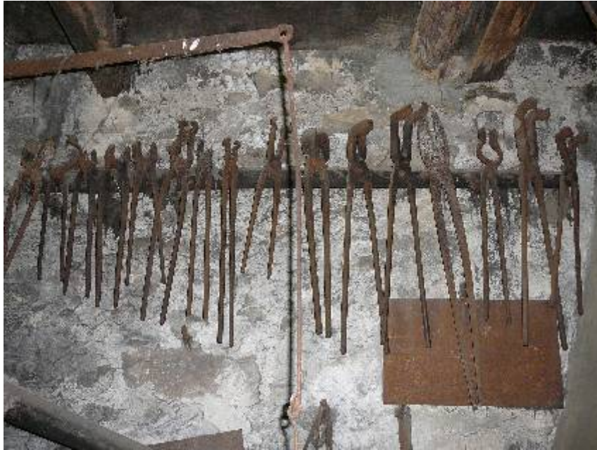
Pinces du forgeron !