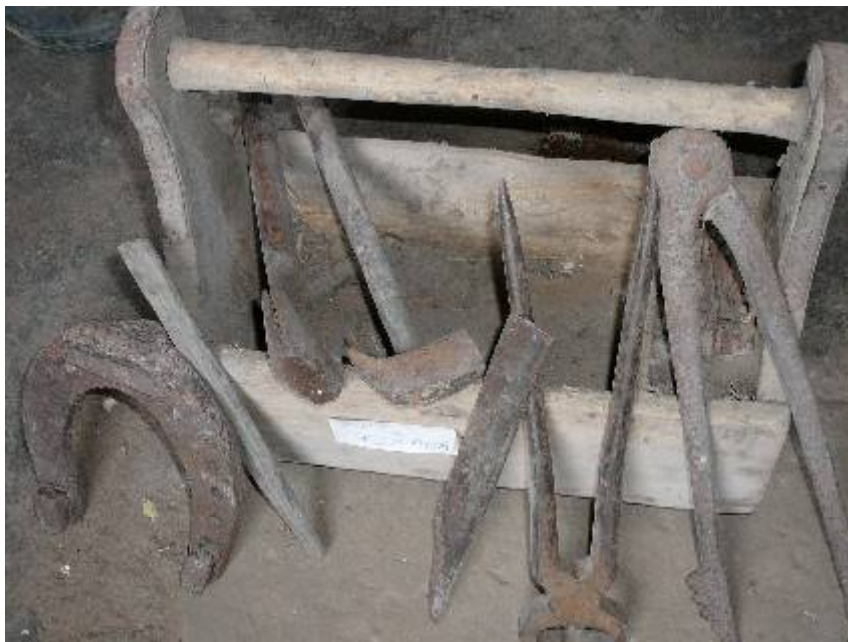
Boite à outils pour ferrer les chevaux !