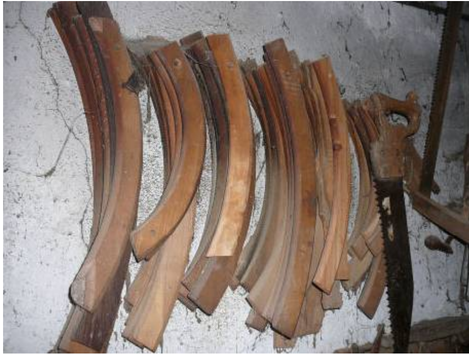
Gabarits de roue de chariot