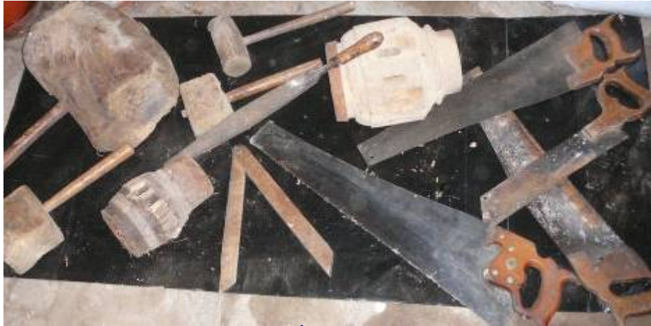
« Tounne », Râpe à bois, Égoïne Moyeux de roue de charriot