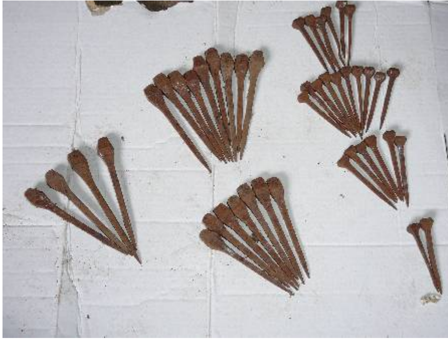
Les clous de fer à cheval et à bœuf !

En 1885 Guyot Jules travaillait avec des bœufs