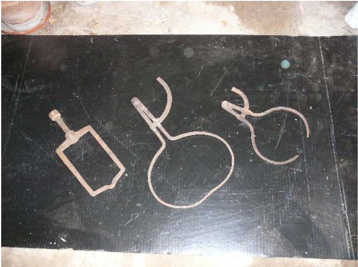
Appareils de mesure