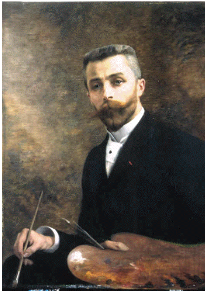
Portrait d' André BROUILLET

Alors que naît et prospère la peinture impressionniste, Brouillet reste un peintre très académique. Il est célèbre pour sa toile Une leçon clinique à la Salpêtrière présentée au Salon des Indépendants de 1887). Jean Martin Charcot est le personnage central lors d'une de ses célèbres séances du mardi, examinant la patiente hystérique, Blanche Wittmann, soutenue par Joseph Babinski .